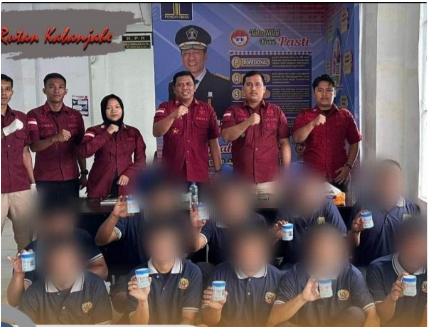
Rutan Kelas IIB Kabanjahe Test Urine Warga Binaan, Jumat (11/10-2024)

KARO - Untuk pencegahan dini akan adanya penyalahgunaan narkotika yang